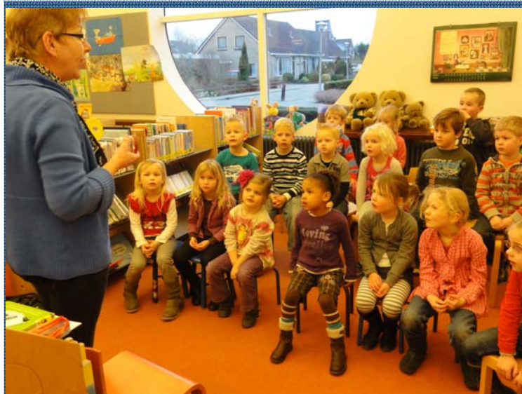
Groep 2 bracht woensdag een bezoek aan de bibliotheek